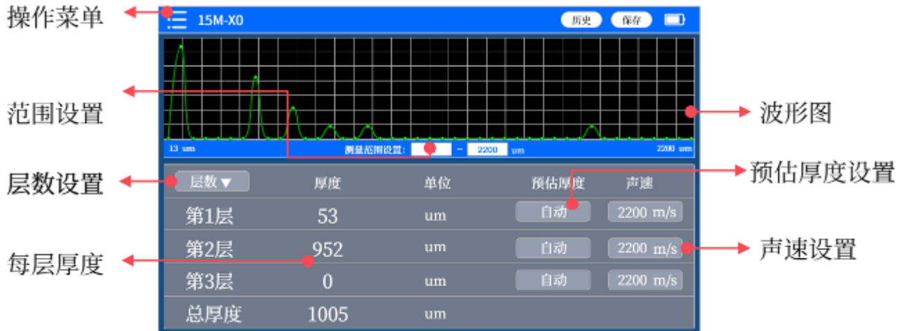
测量 3 层厚度结果